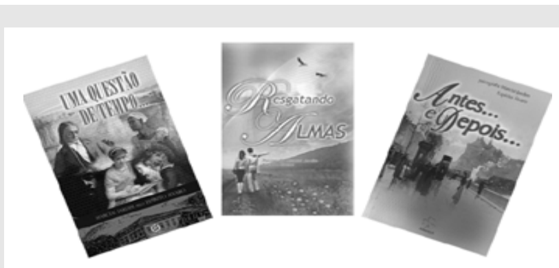
Os livros acima - “Uma Questão de Tempo”, “Resgatando Almas” e “Antes e Depois” - elaborados em nossa Casa de Paz e Amor, encontram-se expostos em nossa secretaria.

“Por um incômodo qualquer, ninguém deve desertar do compromisso” - Livro Doutrina Viva. Chico Xavier