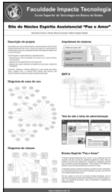
Banner com apresentação da instituição.