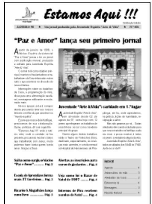
O primeiro informativo do Núcleo, em janeiro de 1998

São muitos a agradecer. Se fossemos colocar o nome de todos aqueles que colaboraram conosco nesses oito anos, não teríamos espaço suficiente nesta edição.