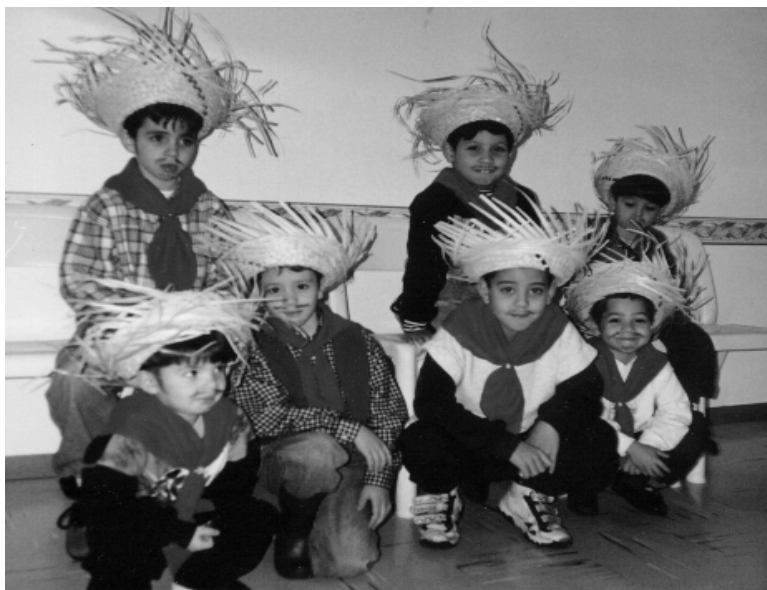
Crianças da Evangelização em Festa Junina do Núcleo, no último dia 20

Desde o início, os trabalhos são marcados pela alegria e vivacidade dos pequenos que iniciam a aula com