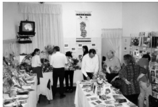
Primeira Feira do Livro realizada em agosto de 1995

Além de todo o acervo espírita disponível, o evento conta ainda com uma lanchonete, onde podem ser